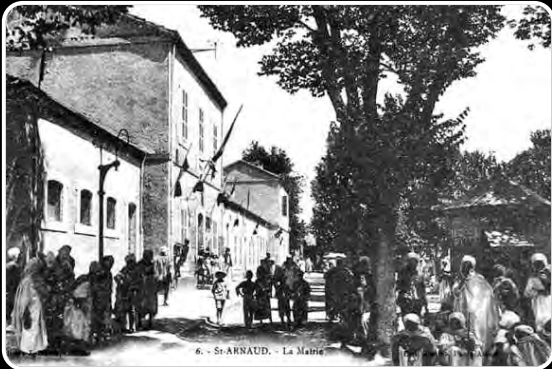
6: - St-ARNAUD, - La Mairie