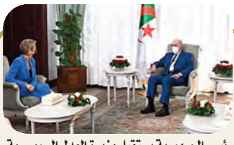
رئيس الجمهورية يستقبل وزيرة العدل التونسية