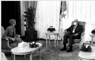
استقبل رئيس الجمهورية عبد المجيد تبون، أمس، بمقر رئاسة الجمهورية، وزيرة العدل والشرطة السويسرية السيدة كارين كيلر سوتر، التي تقوم بزيارة رسمية إلى الجزائر.

وقالت الوزيرة السويسرية في تصريح للصحافة عقب الاستقبال، إن اللقاء مع رئيس الجمهورية كان "مثمرا"، وأنها حظيت باستقبال "جد حار" من قبل الرئيس تبون، مما يعكس الصداقة بين البلدين.