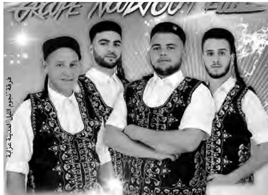
فرقة نجوم الليل لمدينة عزابة

• أشكر يومية "المساء" التي أتاحت لي فرصة التعريف بالفرقة، وهو تشجيع يحفزنا على العمل أكثر.