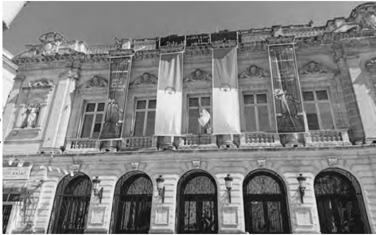
المسرح الجهوي القسنطيني