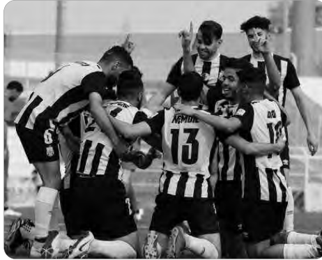
ينتصّر أورلاندو بيراتس هذه المجموعة الأولى (8 ن)، متبوعا بفريق إينييمبا (6 نقاط)، وملمع 1 نوفمبر بتيتزي وزو،

عجزت "الشيبة" عن تحقيق الفوز أمام الفريق المغربي، لتضيق بذلك فرصة ثمينة للاقترب من كرسي الصدارة، وبطاقة الصعود نحو الدور ربع النهائي. وفي اللقاء الثاني لنفس المجموعة، فاز كوتون سبور (الكاميرون) على نابسا ستار (زامبيا) بنتيجة 5-1، وبهذا يبقى "الكناري" في مركز الوصافة لمجموع 6 نقاط، خلف المتصدر كوتون سبور (9 ن)، وقبل نهضة بركان (5 ن)، ونابسا ستار (1 ن)، الذي يتذلل جدول الترتيب. ويرسم الجولة الخامسة وقبل الأخيرة، تتخلف شيبة القبائل لمواجهة كوتون سبور الكاميروني بتاريخ 21 أبريل، بينما يستضيف وفاق سطيف أهلي بنغازي الليبي (28 أبريل).