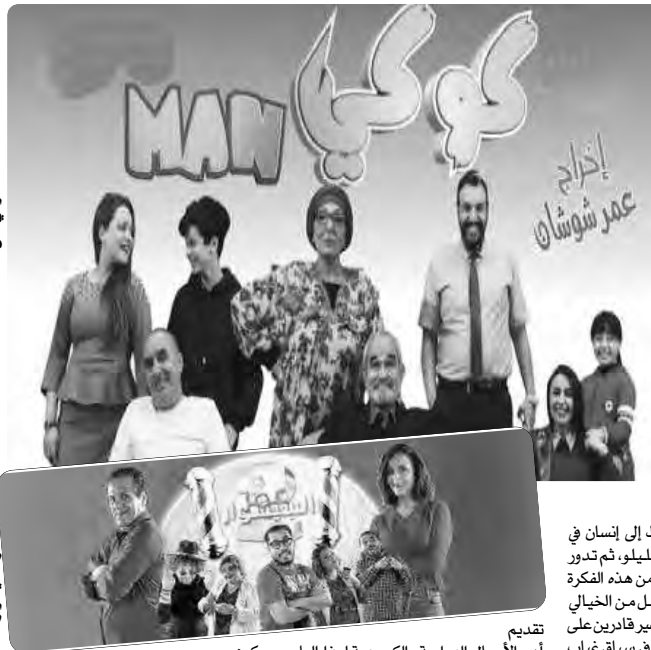
إخراج عمر شوشان

نجد كذلك سلسلة "كوكي مان" للمخرج عمر شوشان، التي تجمع بين الاستسهال والابتذال، يعرض على القناة نفسها، ورغم