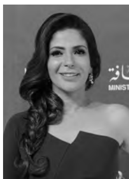
اللاتي ربما سيتعذر عليهن "هذا المستوى من الإجابة والدقة في استخدام كل الأدوات التي يمكن أن يستخدمها الممثل في التعبير، حتى خصلات الشعر، قبل أن تختبئ تحت غطاء رأس طبي..."

المسلسل من قصة وإخراج تامر محسن، وأشرق على الكتابة مها الوزير، وبطولة منى زكي، محمد فراج، محمد مدوح، سيد رجب، عائشة بن أحمد، وممثلون كثرون.