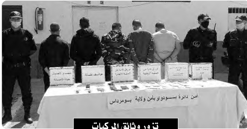
تزور وثائق المركبات