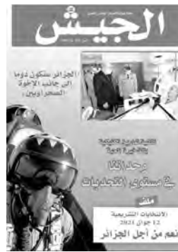
الجزائريون يستقبلون الرئيس عبد المجيد تبون في مطار الجزائر

قد أصبح أكثر وعيا ولا يمكن تغليله أو دفعه إلى متاهات محفوفة بالمخاطر، وسيستجند ضد كافة المخططات الحية وسيبقى كما عهدناه وفقرة رجل واحد إلى جانب مؤسسات دولته وفي وجه كل المترصين". وأشارت الافتتاحية، إلى الأوضاع المتقلبة وغير المستقرة التي تعيشها دول الجوار، وما تخلفه من "قوضى عارمة وجرائم مستفحلة وإرهاب يبعث مرة أخرى عن موضع قدم ومواقع جديدة، وكذا التدخلات المباشرة وغير المباشرة لبعض الدول لإلزام سياستها ونهب الخيرات والثروات، علاوة على استغلال القضاء السبيرياني، شرن شكل جديد من الحرب يعتمد أساسا على وسائل التواصل الاجتماعي التي أضحت ملاذا لشركات إجرامية منظمة تتخذ منها وسيلة للتضليل وفوضى حملات عدائية مغرضة قصد زرع الفتنة بين أفراد الشعب الواحد". وأوضحت أن كل هذه المسجديات والمخاطر "تأزم بلاندا من أجهزتها والتصدي لها بكل الطرق والوسائل والتكيف مع تحديات المرحلة الراهنة من أجل حماية بلاندا وتوفير الأمن لشعبنا". لافتة إلى أن ذلك "لن يتأتى إلا بوعي شعبنا وقضيه الخونة والمرترقة ووقوفه في وجه كل الذين يسعون لضرب استقرار الجزائر وأمنها ووحدتها".