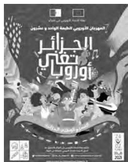
المهرجان الأوروبي للمسرح في مسرح بشطارزي

المنعقدة من كافة ربوع الوطن: في جولة لإنشاء نظرة عن كثر، على التراث الموسيقي الأوروبي: من خلال عروض متنوعة تمزج بين الراي والروك والبوب والقبلاوي، مرورًا بالموسيقى الكلاسيكية، والأندلسية، والقبائلية وأيضًا الشاوية.