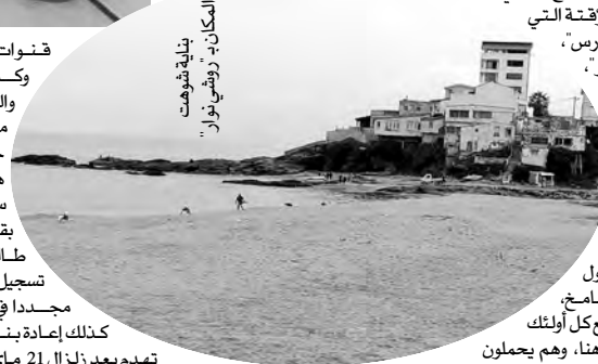
المكان - "الروشي نوار" بولاية قسنطينة

الملاحظ بكل الدعائم السياحية المروجة لولاية بومرداس، أنها تحمل صورة "الروشي نوار"، فالولاية مرتبطة بهذه التسمية منذ عقود طويلة، والمكان بذلك أحسن ترويج للولاية ككل، كونه مرتبط بشكل وثيق بمرحلة مهمة جدا في تاريخ الجزائر المستقلة، سنأتي على ذكره، وحسب الروايات التاريخية التي تحتفظ بها الذاكرة الجماعية هنا بالمجتمع المحلي، فإن "فيلاج الروشي نوار" كان بنهاية خمسينيات القرن الماضي، يحصى بضعة بنايات، يقصدها العمرون من النواحي القريبة للاستجمام خلال الموسم الصيفي، الكولون من ضواحي الثنية ومناطق داخلية أخرى، للاستجمام طيلة الموسم الصيفي، حيث كان "الفيلاج" يشبه قطعنا تاتارت بين زرق البحر والخضر الأرضي المتراصة على مد البصر... رغم ذلك، فإن صيت المكان كان دائما جذب اهتمام العارِشال ديفول، الذي أدرج "الروشي نوار" ضمن مخطط قسنطينة لعام 1958، حيث أدرجت المنطقة (بومرداس حاليا) لتصبح العاصمة الإدارية،