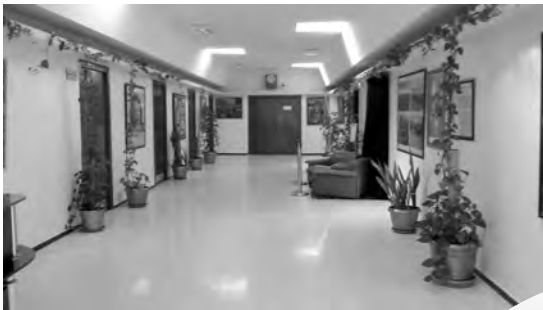
مقر الحكومة المؤقتة