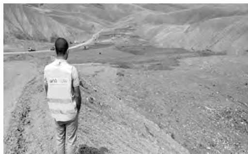
مفرغة الكرامة بوهران تستحوذ على 85 هكتارا

حسب المتحدث، فإن العملية انطلقت في المرحلة الأولى بالولايات الساحلية، التي مكنت من تحديد هذا الكم الكبير من المفاغ عبر 17 ولاية، أكبرهم تلك الواقعة بمنطقة الكرامة في ولاية وهران، تتربع على مساحة 85 هكتارا، وكانت تحتوي على 6 ملايين متر مكعب من النفايات، قبل الشروع في إعادة تهيتها والقضاء عليها، وتحويلها إلى