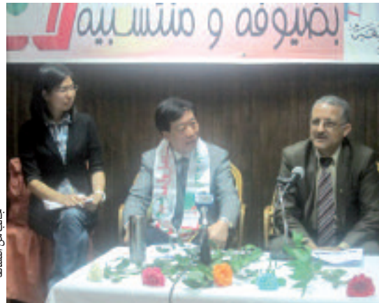
الوفد الصيني في زيارة لبلدية الجزائر