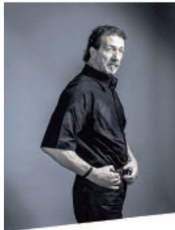
لونيس آيت منقلاات

يبدو أن المطرب القبائلي لونيس آيت منقلاات يسير بمنطق "لا يغني الفريق الذي يكسب، وعاد يوم الثلاثاء الماضي، إلى جمهوره باليوم