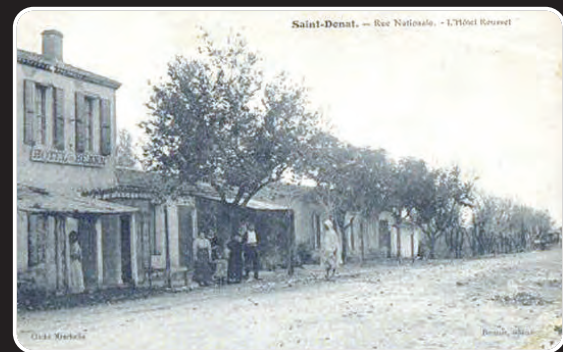
Saint-Denis, - Rue Nationale, - 1/10th Street