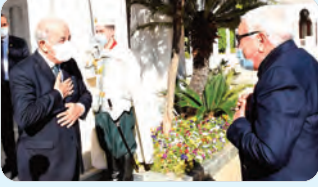
زروال يُهاتف رئيس الجمهورية

العفو عن 11896 شخص بينهم محبسون ناجحون في "الباك"