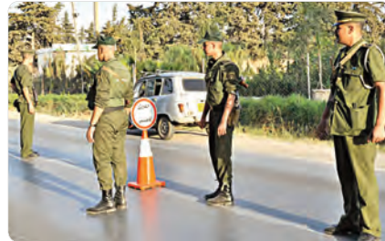
الأشخاص والممتلكات العمومية والخاصة مع المحافظة على البيئة والحيط.

كما تم أيضاً في هذا الإطار تكثيف وتدعيم التشكيلات الثابتة والمتنقلة للدرك الوطني بجهة ضمان المراقبة العامة للأقاليم ليلاً ونهاراً، لاسيما من خلال تكثيف الدوريات المترجلة والحمولة ووضع نقاط مراقبة مع تدعيمها بالتشكيلات الجوية. وشددت قيادة الدرك الوطني وبالنسبة، على ضرورة الالتزام بالتدابير الوقائية المتخذة من قبل السلطات العليا للبلاد والتحلي بقواعد السلامة والصحة العمومية. كما أكدت مواصلة بذل الجهود في سبيل مكافحة تفشي وباء كورونا المستجد (كوفيد-19) من خلال حملة التدابير الوقائية المتخذة للتصدي لهذه الجائحة وغيرها من الترتيبات التطبيقية المصاحبة.