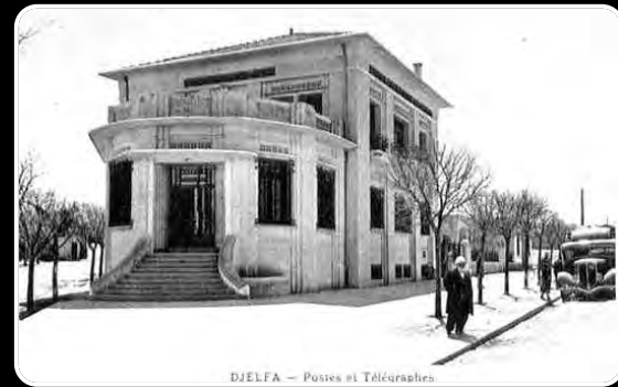
DJELFA - Postes et Télégraphes