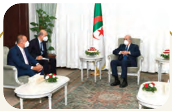
الرئيس تبون يستقبل وزير الخارجية التركي