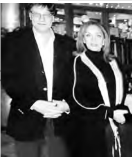
أحلام مستغامي مع الراحل درويش

كتب أحلام "من القلب... الحب لـ 13 مليون محب". وأضافت: "مبروك.. لقد غدننا صفحة بحجم أمة، أمة تفوق في تعدادها عدد سكان أربع أو خمس دول عربية، أيدىها وحدي (ع البركة) بدون وزراء ولا مديرين ولا سفراء ولا خزينة أو مداهيل، ولا جيوش ولا شرطة حدود... بل أنفق عليها من وقتي وجهدي، لبتقى واحدة حرية وورشة بوجد وإبداع جماعي؛ لا أحد يدقق في طائفة أبنائها، ولا في فصيلة حبر المنتسبين إليها، ولا تنتصت على هوائيات مواطنيها، أو منشوراتهم على فيسبوك، ولا يترك أحد فيها من يتامى الأوطان بدون مواساة؛ فنحن في تراحمنا وتعاظفنا كمثل الجسد الواحد، هنا السماء صافية، والكلمات صادقة، والناس طيبون.. إننا في جمهورية المحبة". وتضيف: "أحبتى.. تأخرنا كثيرا في بلوغ هذا المليون بالذات بسبب سياسة فيسبوك، الذي