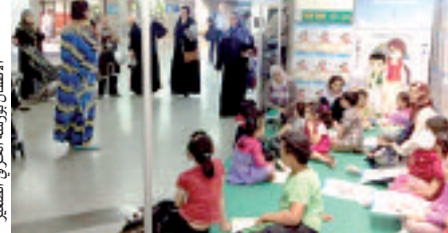
الأطفال بورشة الحرفي الصغير

لا يشعرون بالملل من منطلق أنهم لا يستوعبون المقصود من المعرض وما يحويه من معروضات موجهة طبعا للبالغين، فمننا بتخصيص فضاء يستجيب لتطلعاتهم، ومنه تحقيق غايتنا التي تعمل على إكسابهم ثقافة عامة حول ماهية الحرف التقليدية المحلية.