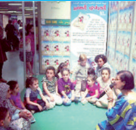
ورشة الحرفي الصغير مع المكونات

طفل اليوم هو رجل المستقبل، وحتى تكون المنفعة ملموسة ومحسوسة، رغبتنا في جمع الحرف التقليدية في قصة صغيرة مملوءة من غرفة الصناعات التقليدية لولاية الجزائر، نتناول بالتفصيل في قالب خطابي بسيط زينته رسومات شخصيات تربط الطفل بالمقرونية ويمكته من اكتشاف ما يزرع به وطنه من صناعات تقليدية بطريقة مبسطة، طالما زينت جهاز العروس.