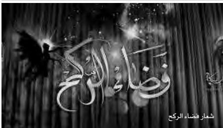
شعار فضاء الركح

وتؤكد إدارة فضاء الركح على تشجيع مواهب الشباب، والتكفل باشغالاتهم، وتمكينهم من التعبير بحيوية عن أنفسهم وبلورة طاقاتهم، وتوفير المحيط اللائم أمام الشباب الجزائري، الذي يمثل شريحة هامة، لها مكانة ملائمة رفيعة في عالمنا الكبير المسرح، لذا ساهمت فضاء المسرحي للطفل والفتيان، مثلما سيعمن استقراء الريبورتاير الجزائري والعربي والعالمي، نصوصا وعروضا ومتابعت بالترزامن مع تكريس النقاشات الكبرى، واستكشاف التوسّط الجا بأعمالها وأعمالها ومآثرها.