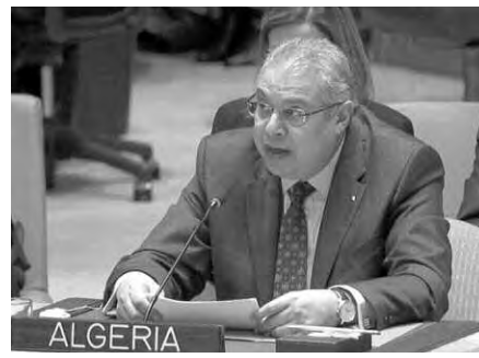
جميعها بنفس الطريقة وهي الفشل.

يضمن تقرير المصير لشعب الصحراء الغربية وهي المقاربة الأكثر براغماتية التي ينبغي دعمها من هذه اللجنة الموقرة والجمعية العامة. كما أكد السيد ميموني أن الجزائر ستواصل دعم جهود الأمين العام للأمم المتحدة والاتحاد الإفريقي لاستئناف المفاوضات المباشرة بين مملكة المغرب وجبهة البوليزاريو، من أجل بلوغ مخرج إيجابي يضمن للشعب الصحراوي الممارسة الحرة لحقه غير القابل للتنازل في تقرير المصير. كما أكد أن "الجزائر ستواصل ضمان دعمها لشعب الصحراء الغربية والأراضي غير المستقلة من منطلق واجب التضامن نحو الشعوب والبلدان المستعمرة".