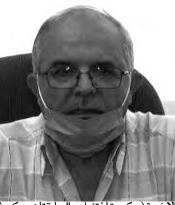
الأخيرة (حكومتاً تنتباهو السابقتان وحكومة نفتالي بينيت الحالية) ضمت ما مجموعه 21 وزيراً إسرائيلياً من أصول مغربية.

الجواب: تم تصميم مشروع الاندماج المغاربي بدوافع خفية كثيرة. إنها تستند أولا وقبل كل شيء إلى خطاب يحمله المشروع ذاته، باعتباره تعبيراً عن إرادة الشعوب بروج إعلان طليحة لعام 1958، بينما المجتمع المغاربي بعيد كل البعد عن أن يكون فاعلاً حاسماً في مسار دام أقل من 5 سنوات، بالإضافة إلى ذلك، كان المغاربة والتونسيون أكثر انفتاحاً على الغرب من الجزائريين وكانوا يفكرون بالفعل في اندماجهم مع أوروبا من خلال توقيع اتفاقيات شراكة مع الاتحاد الأوروبي في عامي 1994 و1995، في خضم الأزمة السياسية والأمنية التي شهدتها الجزائر، وبذلك انتهك مبدأ التضامن