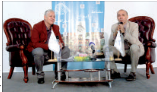
الديوان الوطني للثقافة والإعلام