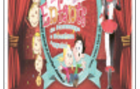
ياسين، خاص بالرجل المعلق والمهرجين والفرقة النحاسية وتقدم لباس ومكياج خاص بالأطفال وكذا نشاطات مختلفة ينتظرها البراعم الصغار بشغف كبير لتزويدهم بعد جهد دراسي مضني.

وعن تجربة كتابة القصص القصيرة جدا، قال طاهر بأنها ليست سهلة، فليس من اليسير التغيير من مسألة في أسطر قد لا تتجاوز الثلاثة، مضيفا أن الكاتب يجد راحة أكبر حينما يكتب رواية أو حتى قصة.