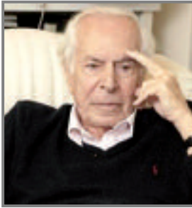
إياه من "تخبة صانعي السياسة والفكر الذي يملك مشورا مناهيا مميّزا وقيما إنسانية عالية". وكان

وأعرب السيد دانيال، عن سعادته البالغة بمنحه هذه الشهادة، مخاطباً الحضور الذين زادهم أبناءه بلدي: قائلا إنه كان منذ نعومة أظفاره "عاشقا" للجزائر، وكان دائما "مؤمنا" بمعدلة القضية الجزائرية ولهذا ساندوا بقلمه. واستذكر مؤسس الصحيفة الفرنسية "توفال أوبيرفاتور" طوّلته بالبلدية ورائحة أزهار البرتقال التي كانت تفتح في شوارع مدينة الورد، وذلك وحديقة باريس لومومبا "بيزو سافانا"، التي كان يتجول فيها والحدائق الغناء التي كانت منتشرة في المدينة وهو ما اعتبره مصدر إلهامه في كتاباته. وفي ختام كلمته ذكر دانيال، مقولة لهرافيسور جاك بيرك، غداة الاستقلال حول عمق العلاقات الجزائرية - الفرنسية التي تجاوزت كما قال تأثير فرنسا الاستعمارية، مشيراً إلى أن الحل لا يكمن في التسديد التجاري ولكن في الإصلاح من الجانبين. وكان عميد الجامعة السيد دانيال، قد أشاد في بداية الحفل بمواقف السيد دانيال، الداعمة لثورة التحرير، معتبرا