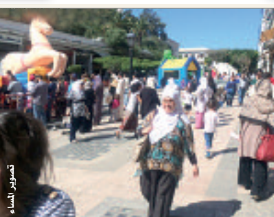
توفي شخص صدمته سيارة

توفي أمس، بسكيكدة أول أمس، شخص (س/م) 35 سنة قاطن ببلدية أم الطوب غرب سكيكدة. في حادث سير بعد أن صدمته مركبة على مستوى مقطع الطريق السيار شرق غرب، بالقرب من المكان المسمى بالخير جنوب سكيكدة. وقد لا صاحبها بالقرار. حسب ما علم من مصدر من الجهة المدنية... الإشارة إلى أن المصالح المختصة فتحت تحقيقا حول الحادث.