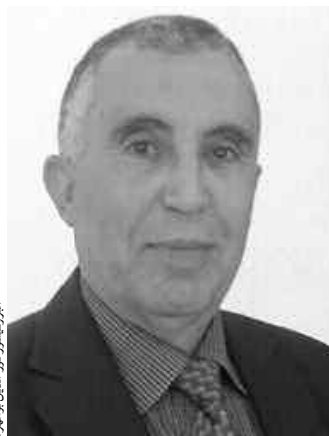
البروفيسور نور الدين بومهرة

«كيف نتخرون إلى واقع التراث في الجزائر؟» التراث في الجزائر، بكل صراحة، يحتاج من الناحية السياسية ويوجه عام إلى إعادة النظر، كونه يمثل قيمة حضارية تتعلق بذاكرة المجتمع الحية.. فما هو موجود الآن والمتداول بالخصوص في الفضاءات الرسمية هو أن التراث جزء من الماضي، وهذه النظرة خاطئة كون التراث ذاكرة حية وتاريخ وحاضر ومستقبل، فعندما نتكلم، مثلاً، عن فكرة الإحياء الثقافي يعني بأنه اعتراف ضمني ورسمي من قبل هيئات رسمية بأن التراث عبارة عن شيء ثابت من الماضي نرجع به إلى الوراء، بينما لا يمكن إحياء التاريخ والتراث، لأنها ما تزال تنبض بالحياة.