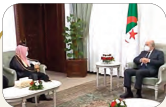
الرئيس تبون يستقبل وزير خارجيتها