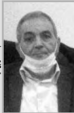
عبد القادر بن عيدة