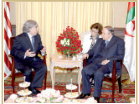
الرئيس بوتفليقة يستقبل كاتب الدولة الأمريكي للطاقة إبراز اهتمام الشركات الأمريكية بالسوق الجزائرية