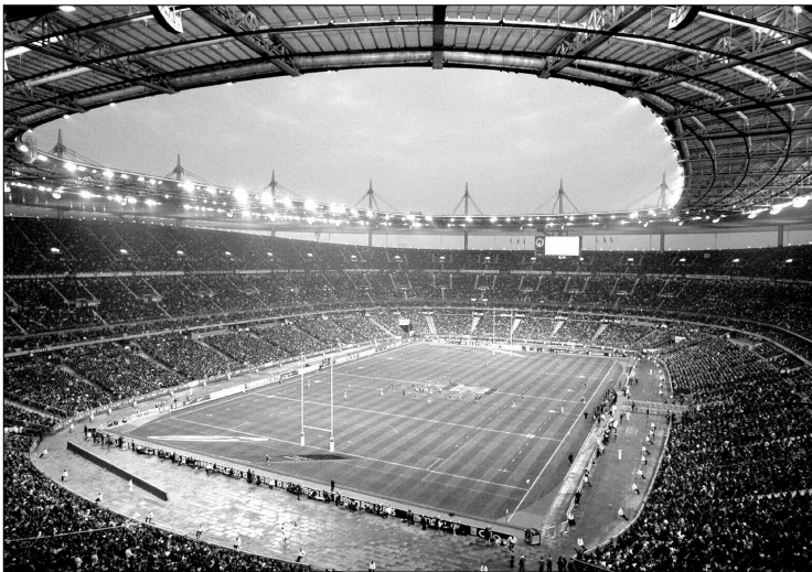
ملعب "ستاد دو فرانس" بباريس