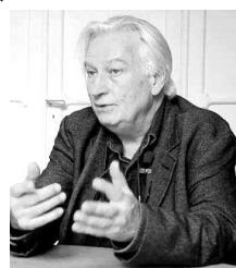
تصريحات ماكرون حول الجزائر لا تليق برئيس دولة

بين الوصاية العثمانية التي مورست على جزء من "الجزائر" (إالة الجزائر) وإيليك قسنطينة، وبين الآلة الجارفة للاستعمار الفرنسي التي رافقها حرب وغزو والحق واستعمار استيطاني واسع... وتابع المؤرخ ذاته يقول إن الحكومات لا ينبغي أن تكتب التاريخ وإنما هي مهمة المؤرخين... وهذا الخطأ التاريخي الفادح دليل على ذلك، مضيفا أنه "من خلال هذا النوع من التصريحات، يكون إيمانويل ماكرون قد أدار ظهره لتاريخه التي أدلى بها في 2017 والتي وصف فيها الاستعمار بجرميّة ضد الإنسانية".