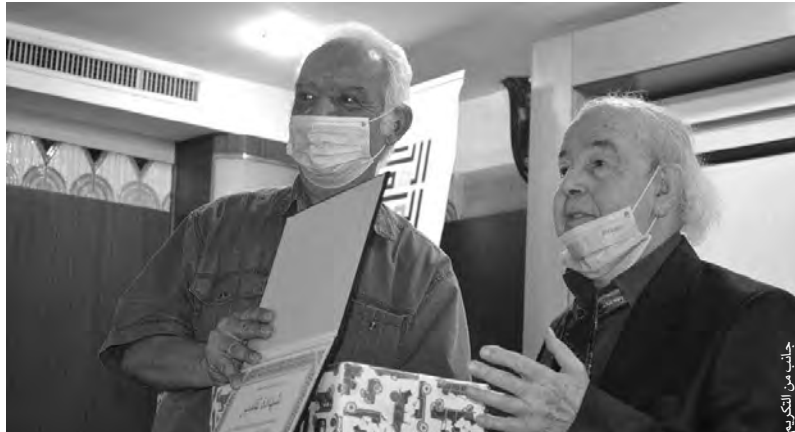
جانب من التكريم

شولش ليتحدث عن مشاركاته في أعمال بن هودقة الإبداعية، حيث قال إنه كان منبهرا بالراحل وتواضعه وعبقريته في الدراما الإبداعية، التي يجمع فيها بين السلاسة والبساطة والعمق، وكان يبدق في كل الشخصيات، مذكرا بمسرحية "الشاعر والضابط" التي تقاسم بطولتها. كما قال، مع العبري عثمان عريوات، وكانت بلغة الشعر الملحون وحقق نجاحا كبيرا. أبدى المتحدث حنينه لجيل العمالقة الذي تعلم منه، جمع مثالا بين بن هودقة وتوفيق المدني ونابيت بلقاسم، مشيرا إلى أن إيقاف هذا التراث الأدبي بمثابة جريمة، حاثا على إعادة بعثه وبثه.