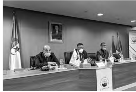
العام لوكالة عدل وإن تطلب الأمر إلى الوزير. كما أمر المسؤول الأول عن قطاع السكن، بضرورة تواجد مدير

أمر وزير السكن والعمران والمدينة محمد طارق بلعربي، أول أمس الخميس، بإلزامية بقاء مدير المشروع بالأحياء السكنية المنجزة في إطار برنامج "عدل" وذلك إلى غاية رفع جميع التحفظات، حسبما أوضحه بيان نشرته الوزارة بصفتها الرسمية على فايسبوك.