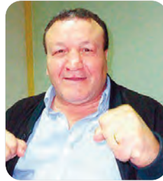
سيمون بيرك ريفوي.

وكتب السيد بن عبد الرحمان، في رسالة التعزية على حسابه الرسمي تويتر "رحم الله أسطورة الملاكمة الجزائرية لوصيف حماني، الذي قدم إنجازات كبيرة للرياضة الجزائرية ومثلها خير تمثيل لمعبد الفعاليات الرياضية بالخارج، وكان خير العون الفعالي بوزارة الخارجية مخلصا ومتفانيا في عمله سواء بالإدارة المركزية أو قسما ببلديات بالخارج.. أخلص التعازي لاهله وذويه وكل محبيه".