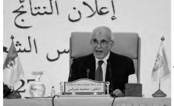
تصوير: ياسين 1

كما ثمن شرفي الدور الكبير الذي قامت به السلطة الوطنية للانتخابات، مؤكدا بأنها نجحت في الامتحان الديمقراطي الذي كان صعبا، وأشار إلى أن المعايير تمكنت من معالجة الإشكالات التي واجهتها خلال الانتخابات، مشيدا بالجو العام الذي ميز الانتخابات، نتيجة التزام المتنافسين بالمبادئ الأخلاقية، ليثي في الأخير على المرافقة المميزة لوسائل الإعلام الوطنية لهذا الحدث السياسي الهام.