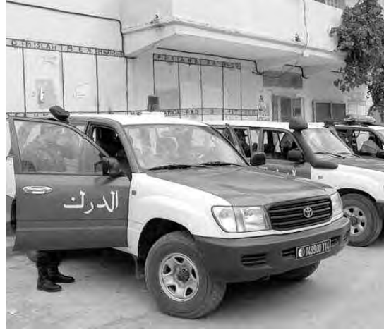
قصد قطع جميع سبل دعم وإسناد الإرهاب وأمن واستقرار بلادنا وحماية وحدتنا والجريمة المنظمة بمختلف أشكالها، ولضمان الوطنية.

وجاء في بيان وزارة الدفاع الوطني، أنه في إطار مكافحة الإرهاب والأعمال التخريبية التي تستهدف أمن واستقرار بلادنا، تمكنت مصالح الدرك الوطني بوهرا من تفكيك خلية إرهابية تنشط لصالح التنظيم الإرهابي "رشاد".