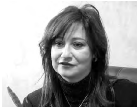
يوميا تتلقت بالانشغالات مواطنين حول حقوق الطفل. وأكدت المتحدثة أن ترقية حقوق الطفل تعد من بين الأهداف الجوهرية

من جانب، أشاد ممثل صندوق الأمم المتحدة للطفولة بالجزائر، اسلاو بوخاري، بما حقته الجزائر في مجال حقوق الطفل، منبرا بأهمية إنشاء الهيئة الوطنية لترقية حقوق الطفل التي تعمل في إطار الشراكة مع كل الفاعلين في المجتمع المدني لتحقيق المصلحة الفضلى للطفل.