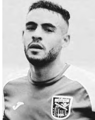
لوكار مطلق العزوبة منذ أسبوع فقط

أما مهاجم نادي نيس الفرنسي أندي ديور، فكان من الأوائل المتفاعلين مع خبر الفاجعة، الذي هز الرياضة الجزائرية وكرة القدم على وجه الخصوص، حيث عبّر في منشور عبر حسابه الرسمي على تويتر، عن تضامنه المطلق مع عائلة الفقيد. ولم تتأخر الاتحادية الجزائرية لكرة القدم "فاف"، في تقديم المواساة والتعازي لعائلة الفقيد وأسرة كرة القدم الوطنية، وكتبت على موقعها الرسمي: "يتقدم رئيس الاتحادية شرف الدين عماره بإسمه وإسم أعضاء مكتبه بعد هذه الفاجعة الأليمة التي أصابت كرة القدم الجزائرية، بأحر عبارات التعازي لعائلة الفقيد وعائلة مولودية سعيدة، راجين العلي القدير أن يتغمده بواسع رحمته".