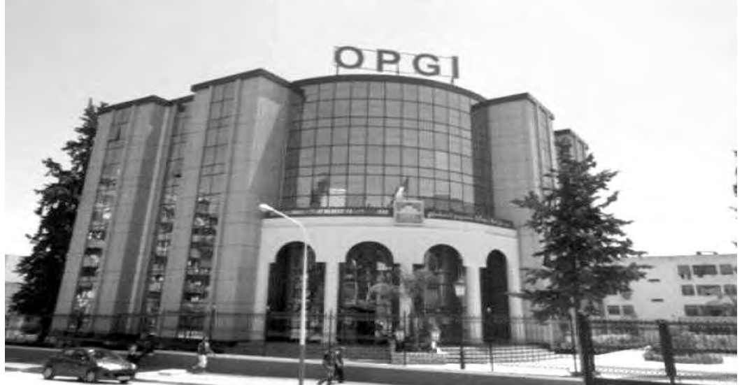
سابقا في فاتورة الكراء.