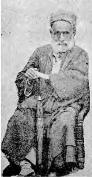
الشيخ العلامة الطاهر الجزائري 1852 - 1920 م