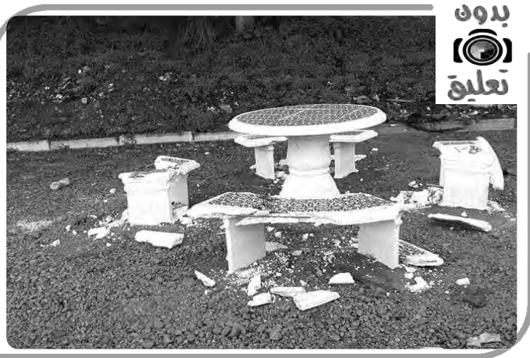
مدينة عين كجيل، تلمسان