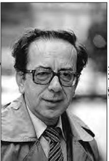
الكاتب الألباني الكبير إسماعيل كاداري

يعد "قصر أحمد باي" أحد أشهر قصور الفترة العثمانية، حيث يعود تاريخ بنائه للفترة الممتدة من 1826 إلى 1835، ويتربع على أرض من 2000 متر مربع، ويروي بالوان متعددة، من خلال اللوحات الجدارية المختلفة، قصة الرحلة التي قام بها أحمد باي إلى غاية وصوله البقاع الإسلامية المقدسة.