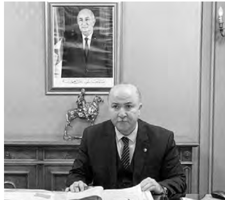
الإحصائية التي تعرض الأعمال التي ينفذها قطاع الرقمنة

تم تقديم عرض حول إنتاج اللحوم الحمراء والبيضاء تم خلاله عرض مؤشرات فروع الإنتاج الوطني ذات الصلة، وكذا آفاق تعزيز وتحسين توفر هذه المنتجات واللوجستيك، عن طريق تنفيذ الأليات التي تم وضعها من أجل عصرنه هذه الفروع، من خلال الانضمام والاحتراافية وتعزيز الشراكة بين جميع الفاعلين.