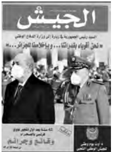
الجنرال عبد القادر بن صالح، قائد الجيش الوطني الشعبي، يترأس جلسة استماع في مقر وزارة الدفاع

اتخذته رئيس الجمهورية، القائد الأعلى للقوات المسلحة، وزير الدفاع الوطني السيد عبد المجيد تبون، لدى زيارته الأخيرة إلى مقر وزارة الدفاع الوطني بترسيم 4 أوت من كل سنة يومًا للجيش الوطني الشعبي، يعتبر "عشرنا من الأمة للمكانة التي يتبوّؤها جيش هو بحق سليل جيش التحرير الوطني، وبالنظر كذلك للإنجازات التي حققها جيشنا الوطني الشعبي منذ زهاء ستين سنة خلت على أصعدة عدة خدمة للجزائر، وفي المقام الأول ما تعلق بالدفاع عن حدودنا المديدة وأمن واستقرار بلادنا".