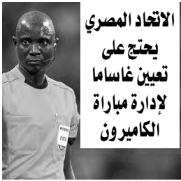
الاتحاد المصري يحتج على تعيين غاساما لإدارة مباراة الكاميرون

قدم الاتحاد المصري لكرة القدم اليوم، احتجاجا رسميا للجنة الاتحاد الإفريقية لكرة القدم على تعيين الحكم الغامبي بكارى غاساما، لإدارة مباراة الكاميرون ومصر المقرر إقامتها اليوم، بملعب أوليمبي بمدينة ياوندي في الدور، قبل النهائي لكأس إفريقيا للأمم المقامة حاليا في الكاميرون. يذكر أن الكنفدرالية الإفريقية لكرة القدم، عهدت مهمة إدارة المباراة للغامبي بكارى غاساما، بمساعدة الأنغولي جيرسون دوس سانتوس والموزمبيقي أرسينيو شادريك، بينما سيكون البوتسواني جوشوا بوندو حكاما رايغا. كما قدم الاتحاد المصري لكرة القدم "الكاف" عريضة تضم كل منتهى ردودا كاملة، عما حدث في أعقاب نهاية مباراة مصر والغرب، وملابسات عدم تمكن مدرب المنتخب الوطني كارلوس كيروش من حضور المؤتمر الصحفي قبل المباراة نفسها.