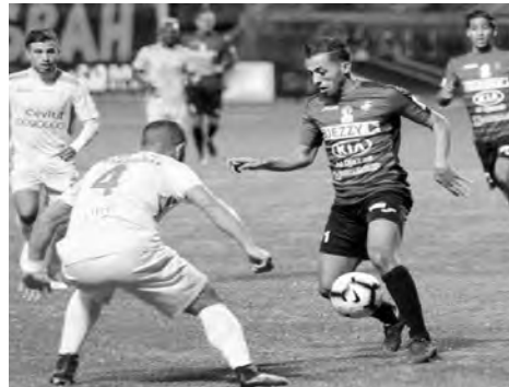
نادي بارادو - شباب قسنطينة 1-1 اتحاد الجزائر - شبيبة القبائل 0-0