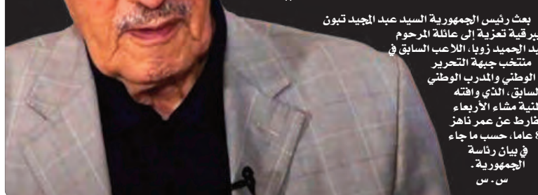
بعث رئيس الجمهورية السيد عبد المجيد تبون ببرقية تعزية إلى عائلة المرحوم عبد الحميد زويا، اللاعب السابق في منتخب جبهة التحرير الوطني والمدرّب الوطني السابق، الذي وافته المنية مساء الأربعاء الفارط عن عمر ناهز 87 عاما، حسب ما جاء في بيان رئاسة الجمهورية. س.س.

عائلة المرحوم عبد الحميد زويا، اللاعب السابق في فريق جبهة التحرير الوطني والمدرّب الوطني السابق، جاء فيها، "يرحل أجركم، إننا له وإننا إليه راجعون".