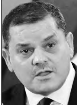
عبد الحميد الدبيبة