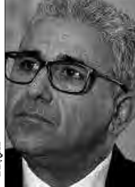
عبد الحميد الدبيبة

الحكومة وفقاً للاتفاق السياسي الأخير، في إشارة واضحة لرفضه الاعتراف بقرارات مجلس النواب. وهو ما يطرح أكثر من علامة استفهام حول مصير العملية السلمية في ليبيا التي لم تكتمل محطتها الأخيرة، بعد فشل الفراء الليبيين في تنظيم الانتخابات العامة التي كانت مقررة في 24 ديسمبر الماضي، وما تلاها من تضارب في الآراء والمواقف بما انعكس سلبا على الوضع العام في هذا البلد. وكانت وسائل إعلام محلية أفادت بأن سيارة رئيس الحكومة عبد الحميد الدبيبة، تعرضت ليلة الثلاثاء إلى الأربعا، لعملية إطلاق نار عندما كان متوجها إلى مقر سكنه من دون أن يعرف ما إذا كان الدبيبة محولة "اغتيال". وأمام هذا المشهد المتوتر وجدت الأمم المتحدة التي رعت مسار السلام على مدار