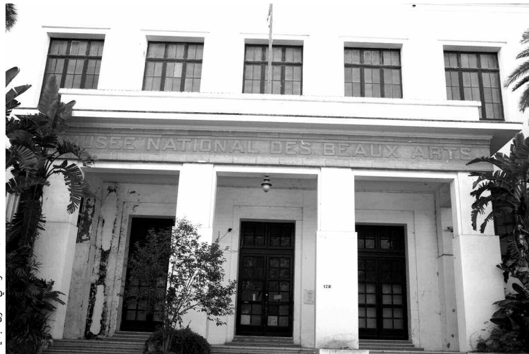
المتحف الوطني للفنون الجميلة

تحتضن قاعة «عائشة حداد» بالمتحف العمومي الوطني للفنون الجميلة في العاصمة، إلى غاية الثلاثين سبتمبر القادم، معرضا ثمانية وثلاثين عملا فنيا لفنانين أوروبيين من فترة بين القرنين الرابع عشر والسادس عشر، تمثل لوحات زيتية ومنحوتات ومقوشات، بعضها يعرض لأول مرة منذ حوالي 40 عاما.