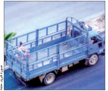
صورة صديقي لوزة