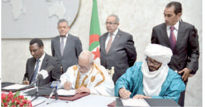
الرئيس البعثة الأممية في باماكو يشيد بجهود الجزائر في إرساء السلم