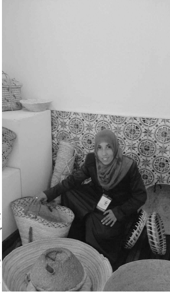
الحرفية في الفخار من تيزي وزو

اختار المهرجان الوطني للإبداع النسوي هذه السنة الاحتفال براهب من روافد التعبير الثقافي للنساء، وهو فن الطبخ الجزائري المعتمد على الحبوب، والذي تحتل فيه الأكلة التقليدية الوطنية «الكسكي» مكانة اجتماعية لا جدال فيها. وترتبط هذه الأكلة، حسب الملاحظين، بشكل وطيد بالأرض، لأن إبداعات المرأة لا حدود لها، فقد طلعت مصادر كثيرة من الطبيعة خدمة لهذا الطبق التقليدي.