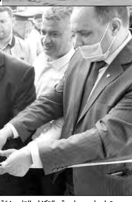
عدة نقاشات بجوارحة إلى اشتراكات فائدة أطفال التوحد

تحت إشراف أخصائيين نفسانيين وأروطونيين تربويين، وتم وضع برنامج نفسي تربوي مع خطة فردية لكل طفل، وإبعدها تأتي عملية التكفل النفسي للطفل، فضلا على أن عامل الوقت مهم جدا.