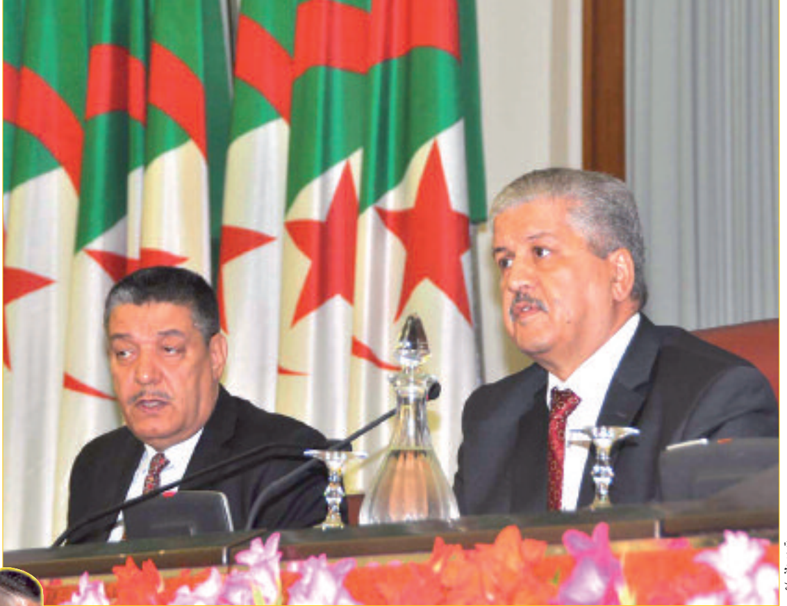
ت. أمستش / ع

أكد الوزير الأول السيد عبد المالك سلال، أن الصحة العمومية كانت ولا تزال من أولويات الحكومة التي أبرزت أهميتها في برنامجها الذي صادق عليه البرلمان مؤخرا، مضيفا أن قضية الصحة ليست قضية إمكانيات مالية فقط، وإنما هي قضية تخطيط وتنظيم ورؤية. - ص 03