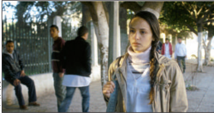
لقطة من فيلم الأيام السابعة.

كيتيل برندا بلين، دولوريس هيريديا، إيلين بروتستين ولويس قوزمان، وتدور أحداث الفيلم حول مصير السجين الأسود غارنيت الذي اعتنق الإسلام، وبعد مرور 18 عاما في سجن نيومكسيكو، يحصل على الإفراج المشروط ليعود إلى مدينته من جديد، وهو يأمل أن يمحو تلك المرحلة من حياته حياة جديدة تبده عن ماضيه الأسود، إلا إلى حياته الطبيعية والاندماج بعدها في المجتمع، لكنه يحاصر بالرقيب الذي يحول حياته إلى جحيم ويتابعه المراقب القضائي، لكن ماضيه سيظل ثانيا على الأحداث وتفتح الملفات القديمة، فيعيش كايوسا حقيقيا بسبب ملاحقات وضغوطات عرقية عنصرية مليئة بالضغينة من طرف العمدة هاري في كيتيل بنيومكسيكو.