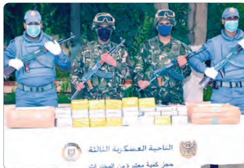
الناحية العسكرية الثالثة حجز كمية معتبرة من المخدرات

من جهة أخرى أحبط حراس الحدود. حسب الحصيلة. محاولات تهريب كميات كبيرة من المواد مخدرات بقيمة 21408 لتر بكم من تمرناست وتيسة والطارف وسوق أهراس. فيما تم توقيف 293 مهاجر غير شرعي من جنسيات مختلفة بكل من جانت وتلمسان وعين صالح وأردار ويشار وورقلة.