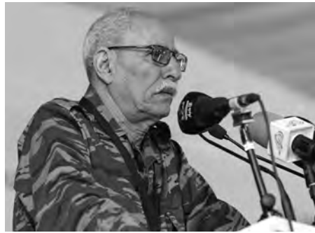
كلية العلوم السياسية والعلاقات الدولية بجامعة الجزائر 3.

وتوج اليوم الدراسي بتوصيات دعت في مجملها إلى ضرورة التركيز على البعد الإنساني للقضية الصحراوية، وفرض محاولة المخزن الاستيلاء على الأرض والإنسان بطمس هوية الإنسان الصحراوي".