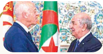
وزير الخارجية التونسي: