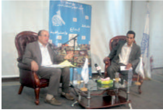
جانب من السهرة الموسيقية