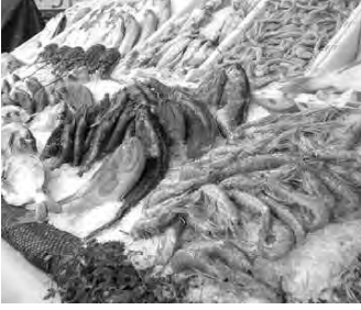
مديرية الصيد البحري بتملمسان