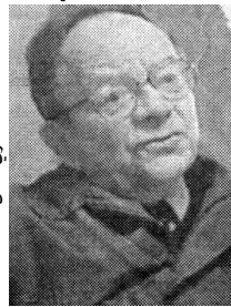
4 19 13

حيا، بل إن بعض المناضلين في الحزب الشيوعي الفرنسي تلقوا تهديدات من قيادتهم تهددهم بالفصل من الحزب إذا اتضح أنهم ساعدوا جبهة التحرير في نضالها