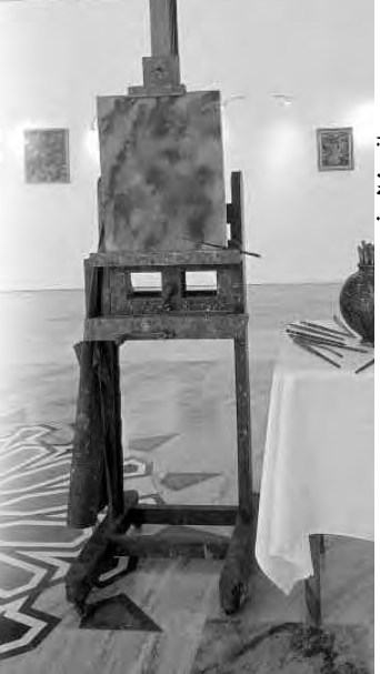
جانب من المعرض

يقدم المعرض الإخص للخص للفنان علي علي خوجة، محطات فنية وحياتية لفنان مخضرم قدم الكثير للفن التشكيلي الجزائري، ورحل عن عالمنا في السابع من فيفري 2010، ويهدأ ثمر 12 سنة على وفاة الفنان الذي ولد عام 1923 بالجزائر العاصمة، حيث رحل بعد مسار حافل من العطاء الفني المتعدد، إذ عرف عن الفنان اهتمامه بالمنمنمات التي تعلم أصولها على يدي خالته محمد وعمر راسم، وكذا الرسم الزيتي والأكوارال والنحت. كما أميط الثام عن أعماله التي أنجزها في سنواته الأخيرة وعن القديمة، منها في هذا المعرض، إضافة إلى الرسومات والطوابع والملصقات الترويجية للأحداث الثقافية، بما في ذلك الطوابع الثقافية الإفريقي الأول للجزائر (1969)، بقية تعريف الزوار بأعمال هذا الفنان، الذي ترك بصمته، أيضا، في كتالوغ الطوابع الجزائرية، إذ لديه أكثر من 5 خمسين طابعا بما فيها أول طابع جزائري مستقل صدر في 5 جويلية 1963، متنوع بطوابع أخرى لوزارة البريد التي صمم لها الفنان الراحل طوابع إلى غاية 1981. كما يمكن زوار المعرض أيضا، اكتشاف أدوات العمل الخاصة بالفنان، من ريشات رسم، ومحمل للوحة، وممزرد.