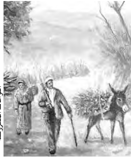
المنظر الخلابة لمنطقة القبائل