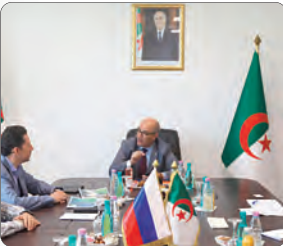
استقبل وزير الانتقال الطاقوي والطاقات المتجددة، بن عزويزان، وفدا عن المؤسسة الروسية "أنشيسيت جيو كو" بزعامة ألكز رحمانتوفين تباحث معه التعاون التقني في مجال التثمين الطاقوي للنفطيات.

وحسب بيان للوزارة، أكد السيد زيان خلال لقاء عقده الثلاثاء بمقر الوزارة على الاهتمام "بالخاص" الذي يوليه قطاعه لإنتاج الكهرباء انطلاقا من الغاز الحيوي الذي يعد مصدرا من مصادر الطاقات المتجددة. وطمان الوزير بأن القانون الجديد حول الاستثمار سيعمل على تحسين مناخ الأعمال من خلال تطوير ومرافقة الاستثمارات، ما سيعطي ديناميكية قوية من أجل تنويع الاقتصاد الوطني.