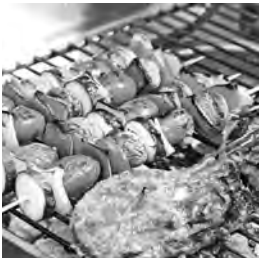
تقاليد متميزة في إعداد أطباق عيد الأضحى