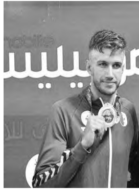
100 متر على الصدر بزم قدره 01 و12 ثا و47 ج.

وقد عرف هذا اليوم الثاني من المنافسة تألق المنتخب المصري بنيله لمجموع 13 ميدالية (5 ذهبيات و4 فضيات و4 برونزيات) بفضل سباحيه المحنكين، الكماش مروان وحمود هدي والعيسوي محمد وعصمان فريدة وغيرهم. تساوي مصري - جزائري منذ البداية وكان اليوم الأول قد تحصل فيه المنتخب الوطني على 11 ميدالية (4 ذهبيات و4 فضيات و3 برونزيات)، ونال الذهب كل من نفسي حميدة رانيا في سباق 200 متر متتو، وفي 100 متر سباحة حرة، وجواد صبيد 200 متر متتو، ومنتخب التتابع 4 مرات 100 متر سباحة حرة، مقابل مجموع 12 ميدالية تحصل عليها المنتخب المصري في اليوم الأول (5 ذهبيات و4 فضيات و3 برونزيات).