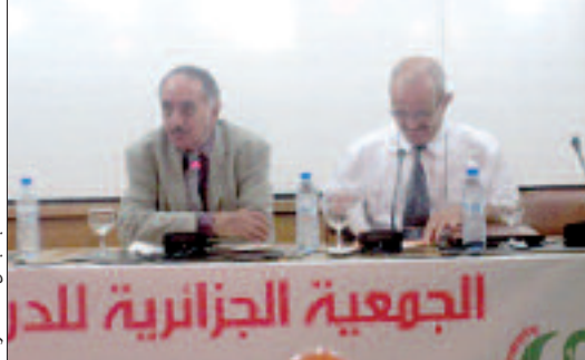
يُمرّ بناء البلد مرور الكرام على اللغة والثقافة. وقدّم عميمور صورة سوداوية عن واقع

الرقص والغناء، أما مسألة النشر فلم يعد يُفرق بين الناشر والطابع، ليضيف أن الكتاب هو عمود أساس الثقافة، وهو ما لا ندركه فعلا. وأضاف أن الدولة اليوم مسؤولة بصفة كبيرة عن واقع الثقافة المتردي، مؤكدا أن وزير الثقافة لا يمكنه فعل أي شيء بدون إرادة سياسية حقيقية تساند الكتاب والثقافة. وأشار وزير الثقافة والإعلام الأسبق إلى أهمية الأسرة، ومن ثم المدرسة في تحبيب الكتاب للطفل، مقدما أمثلة بتنظيم مسابقات في المطالعة، وكذا تلخيص قصص وغيرها، طالبا ضرورة تحرك الجميع لخلق نهضة ثقافية تجسّد رسالة الوطن، الذي هو جزء من العالم العربي والإسلامي والأفريقي، ليعود إلى عهد الرئيس الراحل هواري بومدين، الذي قال إنه كان يهتم بالكتاب، ويتابع الحياة الثقافية الجزائرية، كما سنّ قانونا متعلقا بمنع إقرار الضرائب لكل منتج ثقافي.